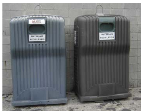
Containers para reciclagem do complexo Marginal

A coleta seletiva superou as expectativas. Foi só começar e já percebemos que o envolvimento de todos aconteceu de maneira surpreendente, mostrando que na CET as pessoas estão conscientes do cuidado que devemos ter com o meio ambiente,