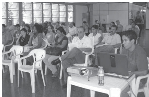
Apresentação do projeto no CETET

A próxima implantação será na THOMAS EDSON