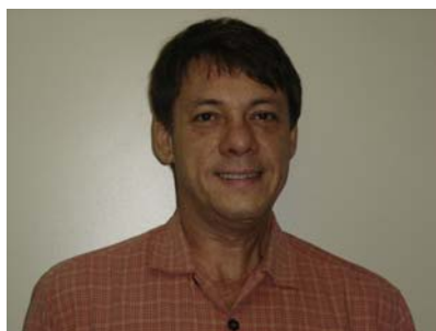
Gurgel (PAC Chuva) (Túneis)

Vejam no site da DR ( www.drctet.net ) mais algumas fotos, histórias engraçadas sobre dia a dia destes anjos e o clip que a equipe da DR fez em homenagem a eles.